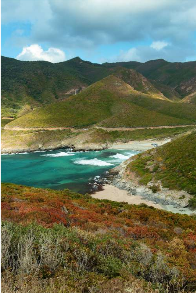
Plage d'Aliso - Aliso Beach

Arrivé à Santa Severa , marine de la commune de Luri , une alternative s'offre à vous. Vous pouvez choisir d'emprunter la D180,