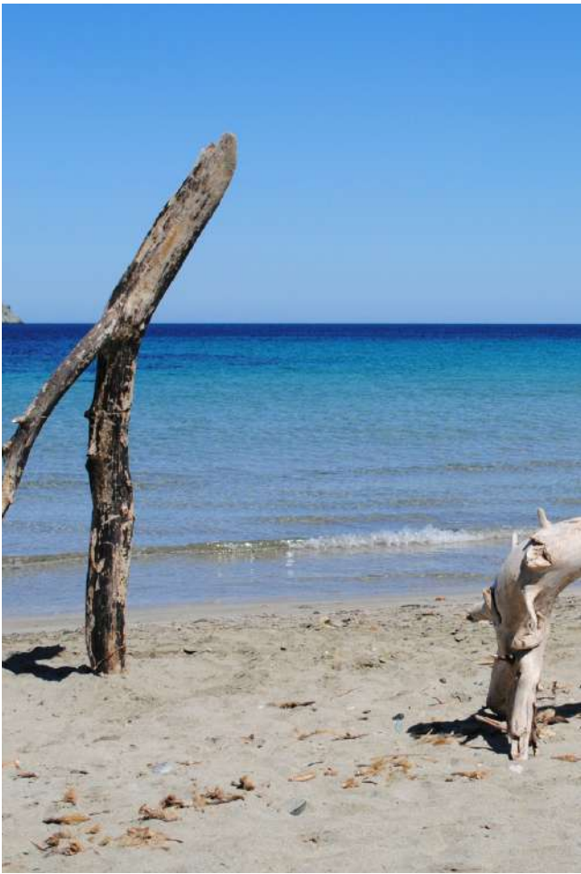
Plage de Barcaggio - Barcaggio beach